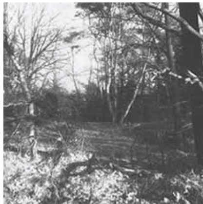
Blick auf das ehemalige Massengrab in Handeloh