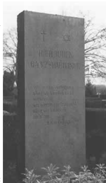
Grabstein auf dem Handelohener Friedhof