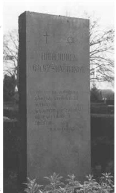
Grabstein auf dem Handelohener Friedhof