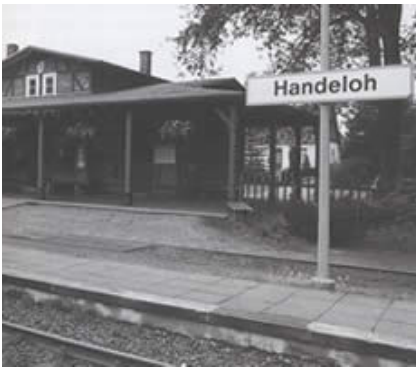
Der Bahnhof Handeloh heute

Dargestellt anhand einer Zeugenaussage, eines Berichtes des damaligen Bürgermeisters sowie der Ermittlungen der Britischen Armee.