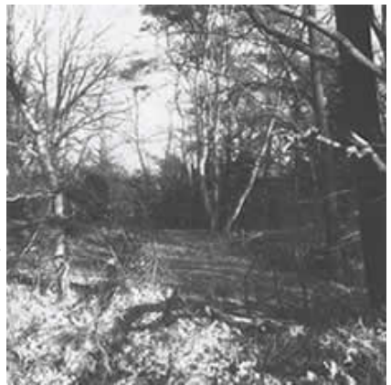
Blick auf das ehemalige Massengrab in Handeloh